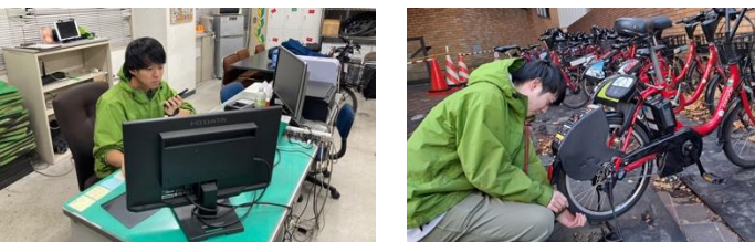
▲サポートセンターで指示を出すリーダーの様子(左) タイヤの確認をしている様子(右)

リーダーを中心として使っているのは、専用のシステム。このシステムで各ポートの自転車台数を把握し調整を行っています。また、自転車の点検、修理もクルーの大事な仕事の一つです。パンクしていないか、反射板はついているかなど、一つ一つ点検を行い、利用者が安心安全にポロクルを使えるような整備も行っています。