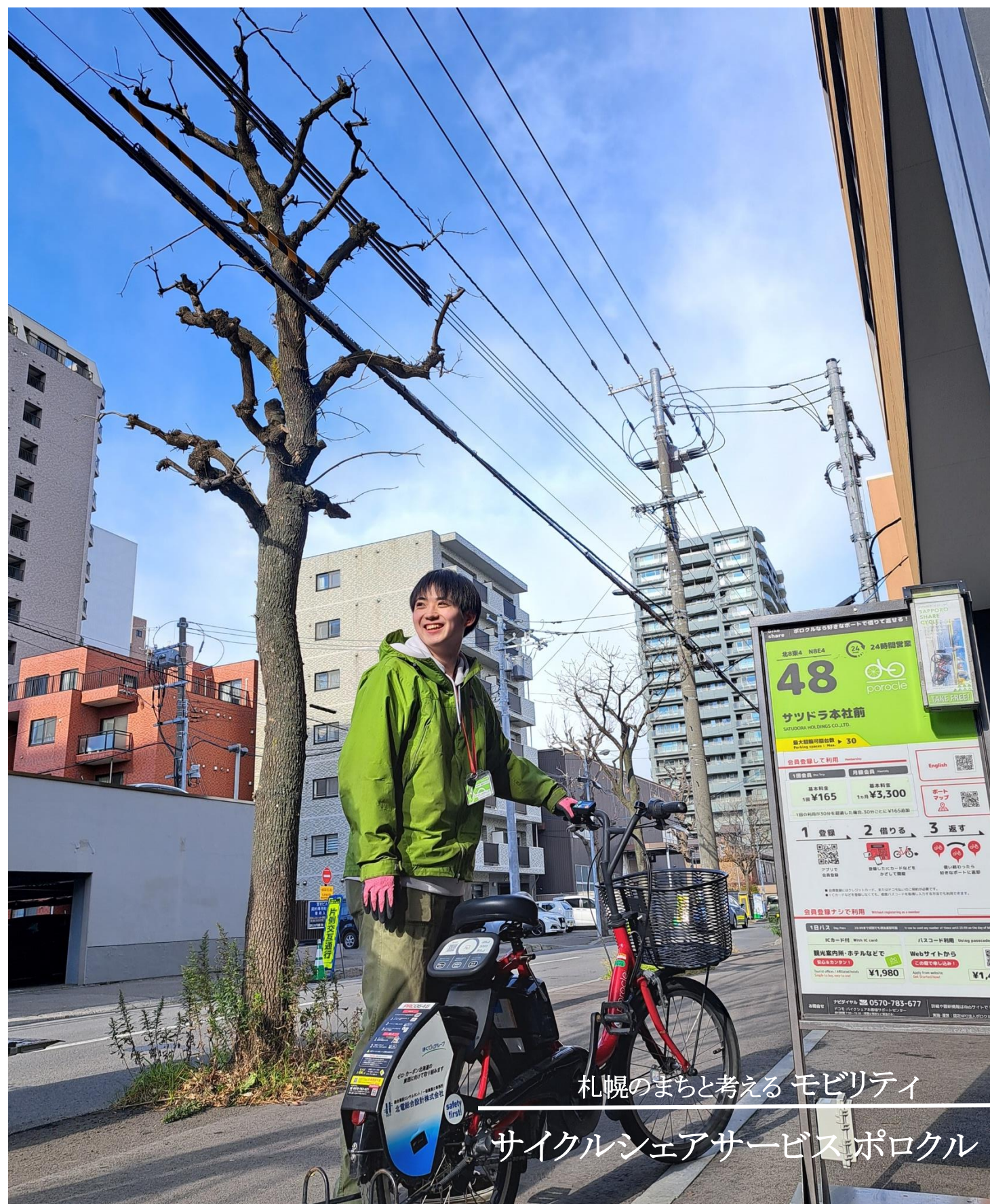
札幌のまちと考える モビリティ